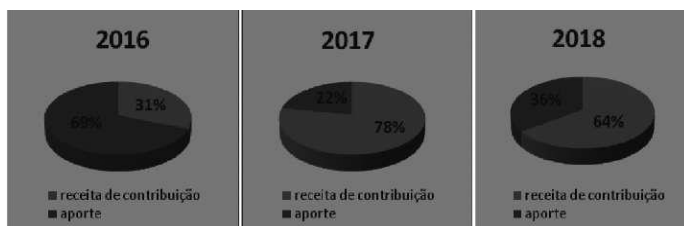
Figura 1 – Evolução da participação dos aportes para cobertura do déficit na despesa total previdenciária (FINANPREV), 2016-2018

Fonte: RREO - Anexo 4 (LRF, Art. 53, Inciso II)